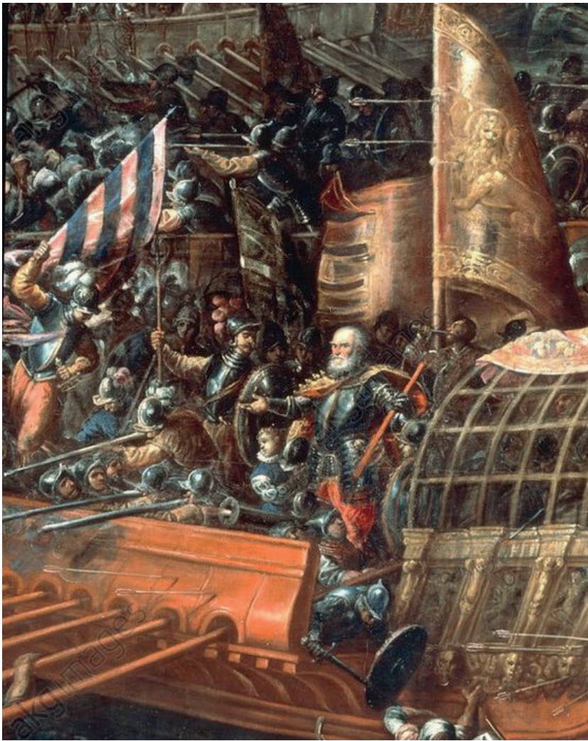
A sinistra: Sebastiano Venier (1496-1578) Capitano Generale da Mar e futuro Doge di Venezia, affronta intrepido il Turco alla battaglia di Lepanto. Accanto a lui, il gonfalone di San Marco. Particolare da un dipinto di Andrea Vicentino del 1603. Venezia. Palazzo Ducale.